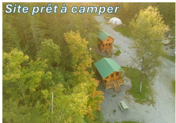
Site prêt à camper