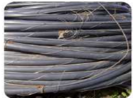
Main avec fils métalliques le long

(soit environ 5 $ par rouleau de 1500' de 1"1/4)