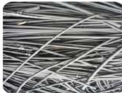
Main sans fils métalliques le long

(soit environ 0,20 $ par rouleau de 500')