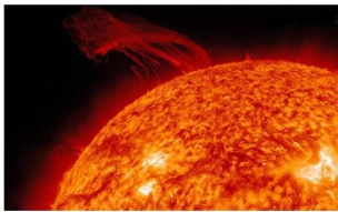
Figure 3 : Eruption solaire vue à travers une lunette solaire.